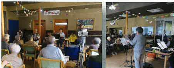
ふるさと園のうたう会

ゆめハウスでは、毎月うたごえ喫茶を開くほか、地域のみなさんと一緒に、ふるさと園でもうたう会を開いています。